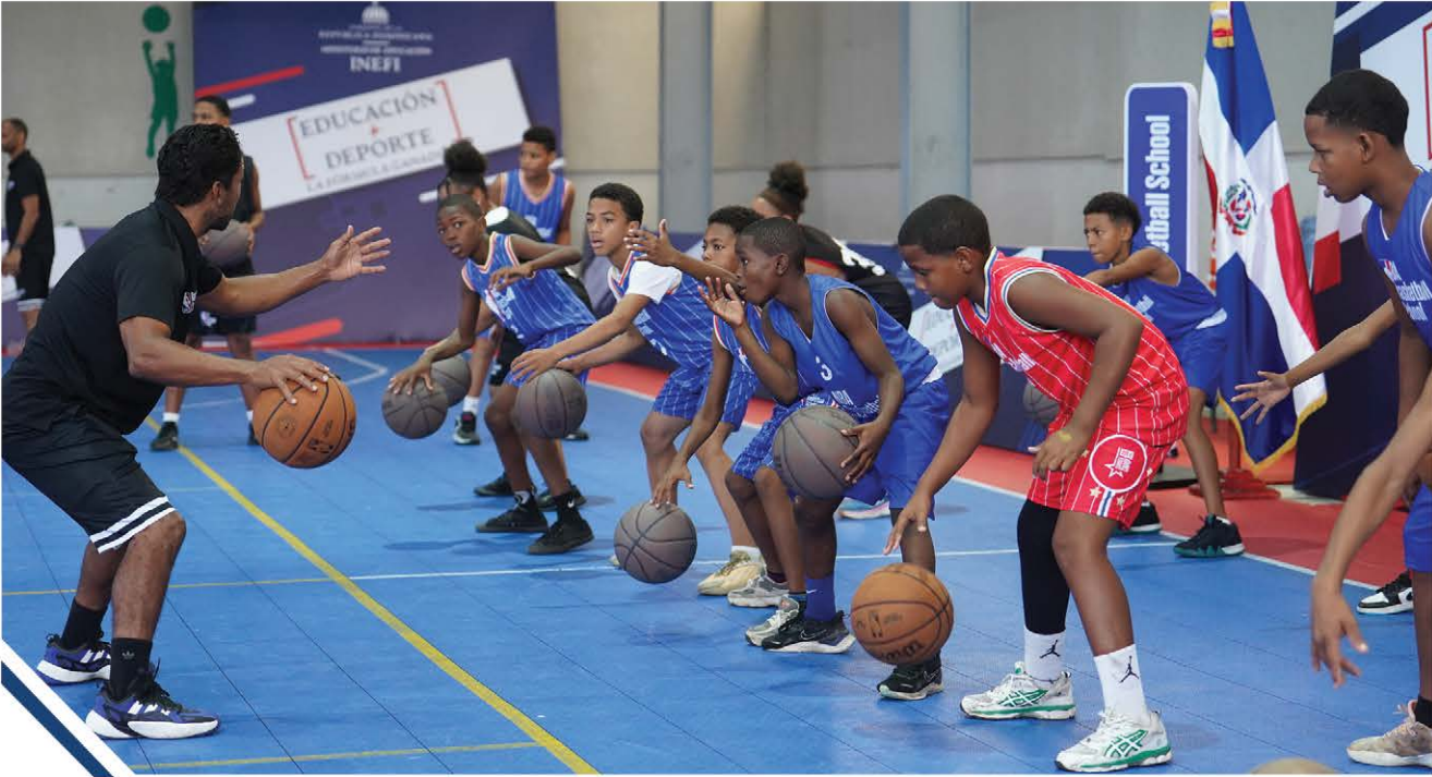
Jóvenes del sector Capotillo reciben entrenamiento por parte del personal de la NBA Basketball School en la República Dominicana.