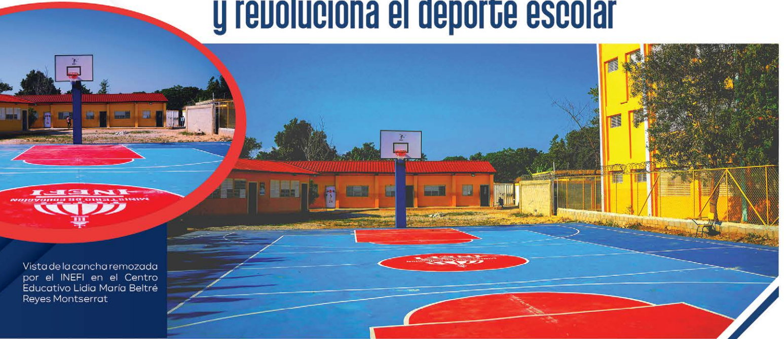
Vista de la cancha remozada por el INEFI en el Centro Educativo Lidia María Beltré Reyes Montserrat.