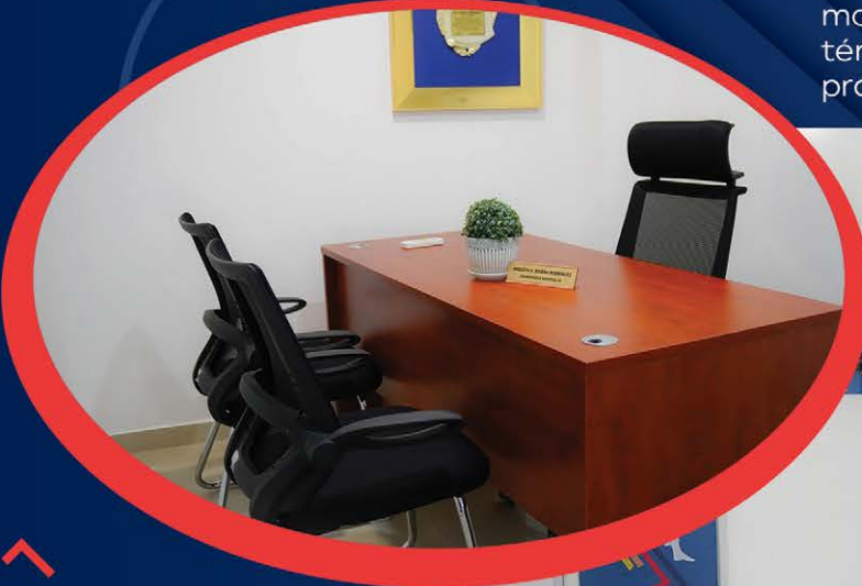
Las oficinas de la subsele del Instituto Nacional de Educación Física (INEFI) en San Pedro de Macorís fueron dotadas de nuevos mobiliarios.

Asimismo, la representante de la Regional de Educación, Distrito 05-01, Aurora Rosado, valoró los esfuerzos del presidente Abinader y del ministro de Educación, Luis Miguel Decamps, quienes han mostrado un gran interés en que las escuelas estén dotadas de instalaciones adecuadas para la práctica deportiva.