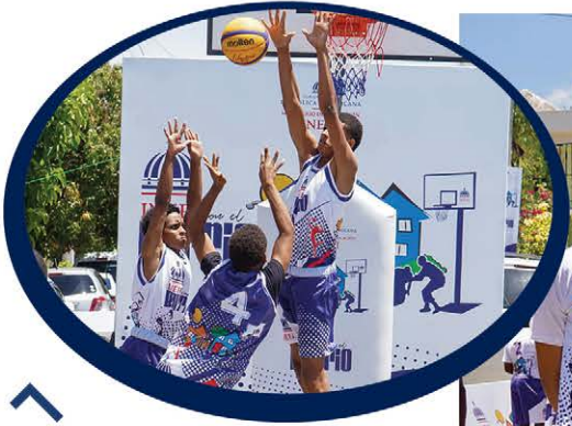
Acción en el torneo de baloncesto 3x3 del programa “INEFI con el Barrio” realizado en Los Mameyes, Santo Domingo Este.