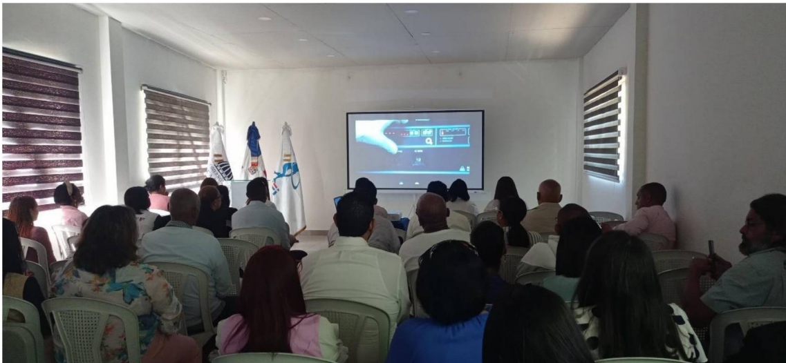
Desarrollo del Cine Fórum junto a los colaboradores.