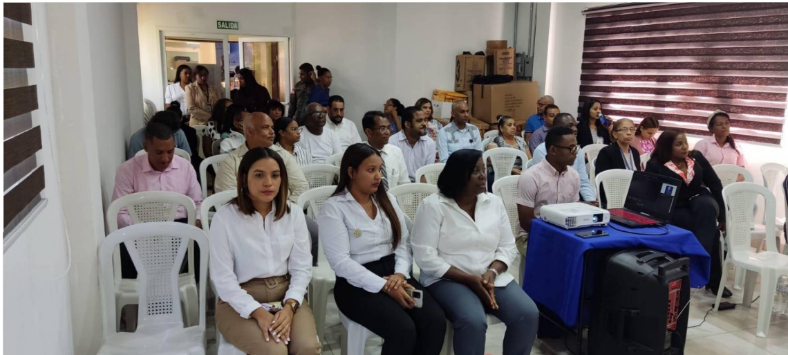
Foto de los colaboradores disfrutando del Cine Fórum.